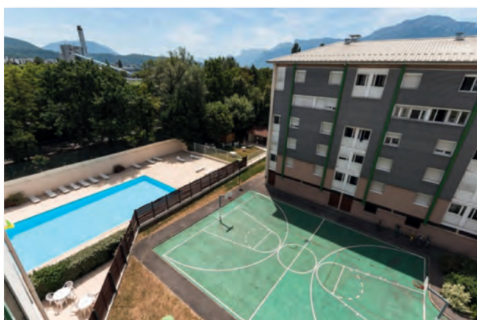
Terrain de basket