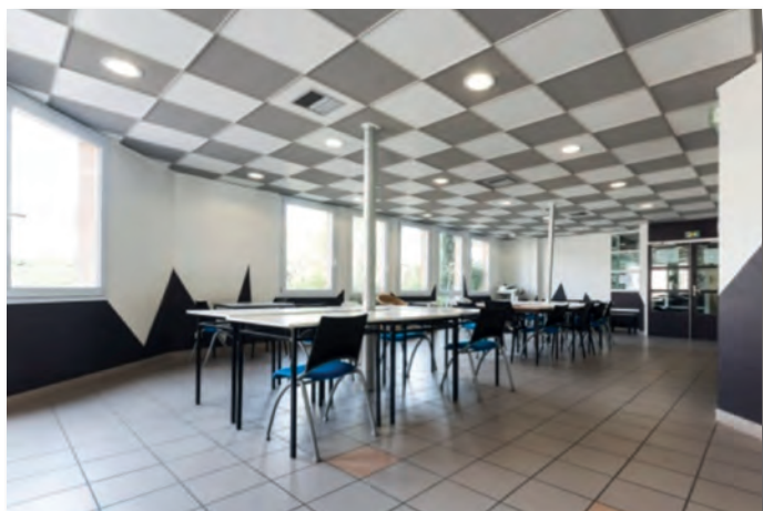
Salle de travail