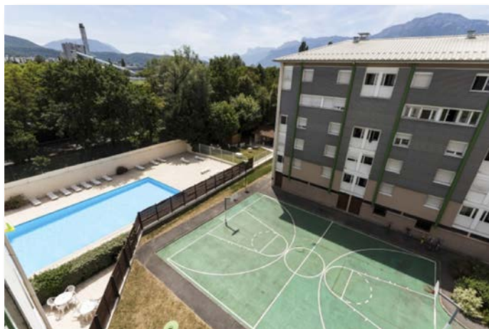
Terrain de basket