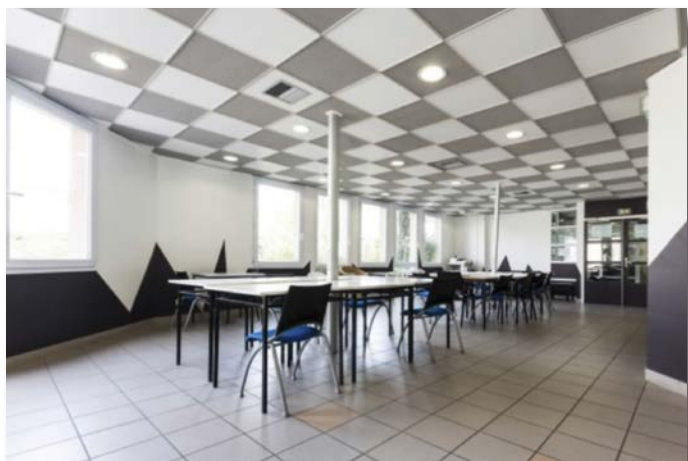
Salle de travail